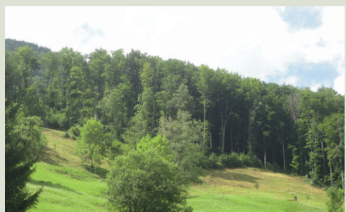
Wertvolle Trockenwiesen auf dem Urmiberg