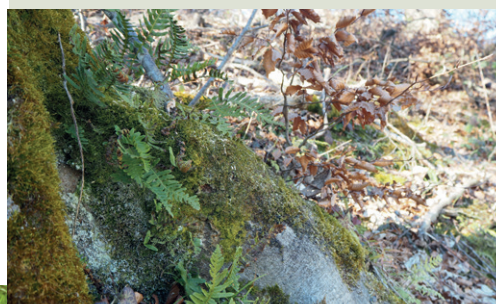
Der Tüpfelfarn wächst gerne auf Baumstrünken.