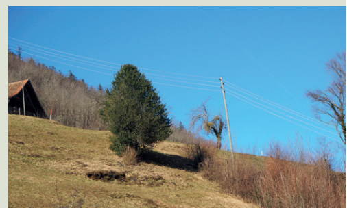
Stechpalmen sind im Winter besonders markant.